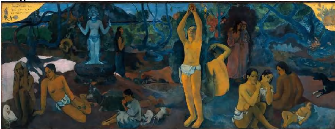
Imagen no. 12 31