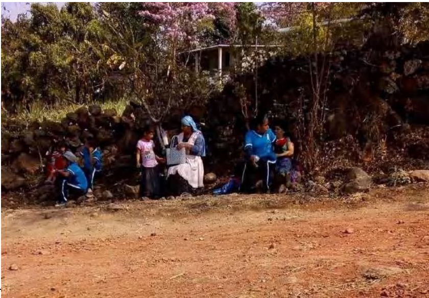
Imagen 2: La espera de los niños 39

39