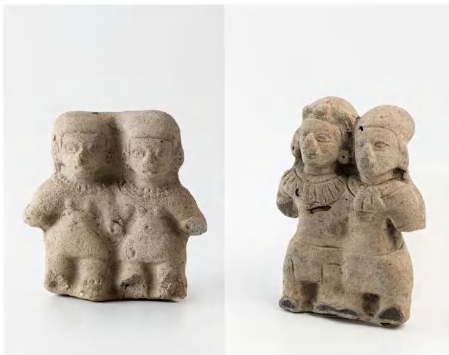
Figura doble antropomorfa, cultura Tolita (Tumaco), cerámica, 13,2 x 10,1 x 2,5 cm.