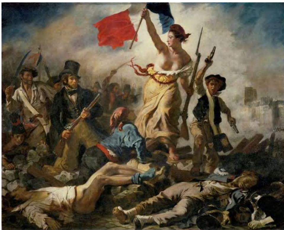
Imagen no. 7 20

El establecimiento del Estado de derechos es el bastión en el cual se ha establecido el ingreso pleno de la humanidad a la Modernidad. A partir de documentos como La Declaración de los Derechos del Hombre y del Ciudadano luego de la Revolución Francesa (imagen 7 de referencia), o La Declaración Universal de los Derechos Humanos hecha por las Naciones Unidas luego de la Segunda Guerra Mundial, se piensa a los derechos como un barómetro que mide el nivel de humanidad de un sujeto, en tanto, los demás podrán percibir mediante la capacidad de acción que tiene el sujeto en los ámbitos públicos y privados. Pero la construcción de los Estados Naciones que ordenan lo público y lo privado, hereda la desigualdad y sexismo naturalizado por el derecho patriarcal, y quienes se encargan de dicha construcción son hombres. Lo que realmente transformaría la teoría contractualista no es la libertad para hacerla un derecho universal, sino que modifica al patriarcado y lo hace 'fraternal'; además, reestructura una división sexual del trabajo hegemónica en la cual, el hombre se encarga de lo público y la mujer de lo privado. La interdependencia en el matrimonio heterosexual se mantie-