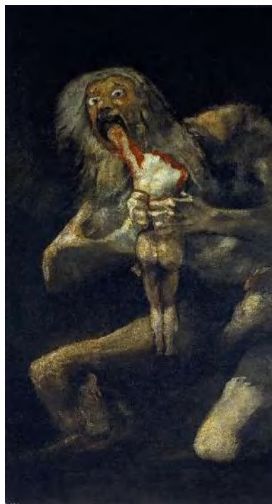
Imagen no. 10 28

Pero, como se dijo antes, ya desde Freud se aceptaba que el género se construye según su contexto. Aquí unos intentos de explicar lo que él llama ‘inversión sexual’: