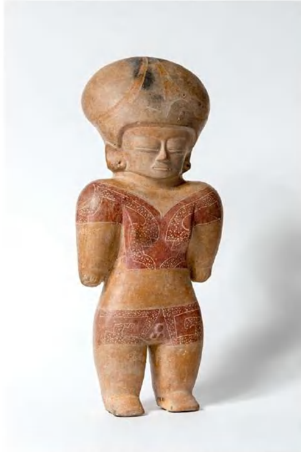
Figura antropomorfa, cultura Chorrera, cerámica, 38,5 x 16,3 x 9,8 cm.