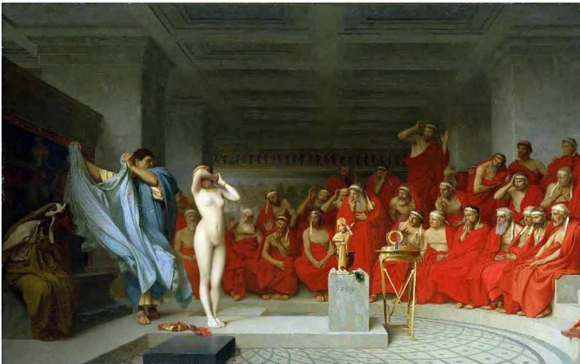
15 Gerome, Jean León. Friné revelada ante el aerófago, 1861 (Óleo). Wikiart. https://www.wikiart.org/en/jean-leon-gerome/phryne-before-the-areopagus-1861