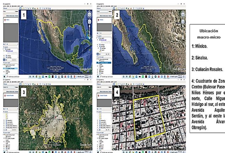
Imagen 2: Ubicación geográfica macro-micro del área indagada en la ciudad de Culiacán