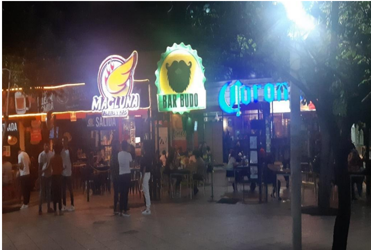
Imagen 4: Interacción nocturna en paseo del ángel de la zona centro de Culiacán