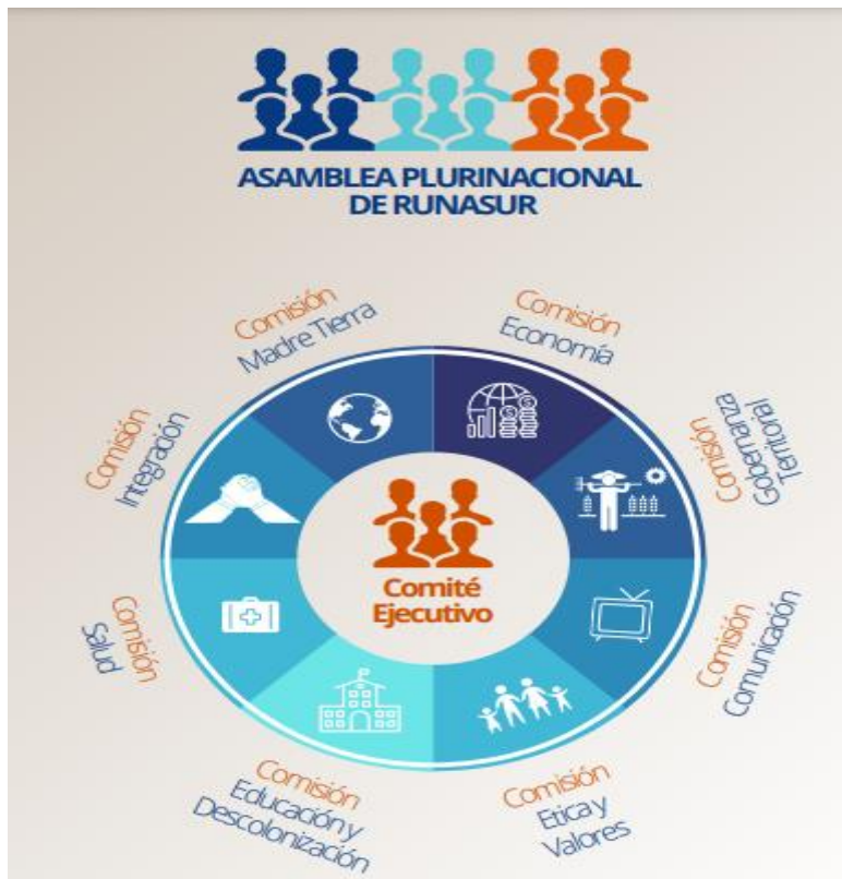
Imagen: Estructura orgánica de Runasur