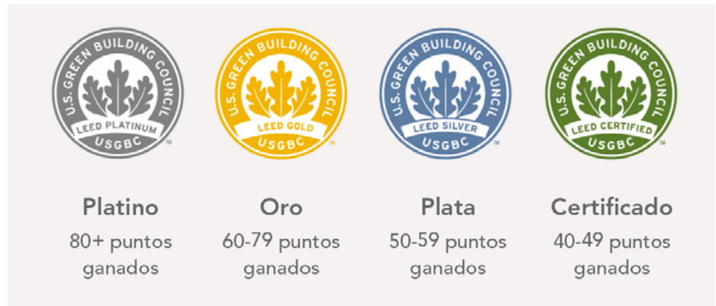
FIGURA 2. Clasificaciones LEED | usgbc.org

Las certificaciones se otorgan de acuerdo con los puntajes mostrados en la Figura 2: