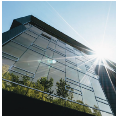
FIGURA 3. Programa de Certificación de Edificaciones Sustentables de la CDMX | Centro Urbano

México se ciñe en general al esquema de certificación LEED desde la creación del Consejo Mundial de Edificación Verde (WGBC, en inglés) en 2011, al cual dicha nación pertenece. La adopción del sistema LEED se debe a su reconocimiento a nivel internacional, pero también a la notable ausencia de un sistema nacional de certificación en cuanto a edificios sustentables. No obstante, la desventaja de esta certificación yace en que se basa en parámetros norteamericanos no adaptados a la realidad mexicana; lo ideal es un sistema de certificación cuyos estándares sean acordes a las condiciones propias. En respuesta, en 2008 el Gobierno de la Ciudad de México estableció el Programa de Certificación de Edificaciones Sustentables.