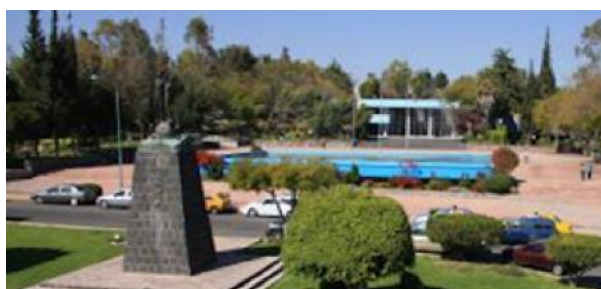
Figura 3. Área de estudio, instalaciones de Ciudad Universitaria de la Universidad Autónoma de Querétaro.

El Área de estudio se define por el campus universitario de la Universidad Autónoma de Barcelona, ubicado en 08193 Bellaterra, Cerdanyola de Valles, Barcelona, España, y las instalaciones del campus central de la Universidad Autónoma de Querétaro, ubicado en 76010 Centro universitario, colonia Las Campanas, Santiago de Querétaro, México.