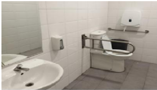
Figura 7. Instalaciones adaptadas, rampas, baños, elevadores y rampas mecánicas.