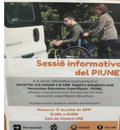
Figura 4. Cartel de sesión informativa del PIUNE.

so se les invita a una plática informativa en la que se les explica paso a paso el proceso de registro y vinculación, los servicios que ofrecen y cómo solicitarlos.