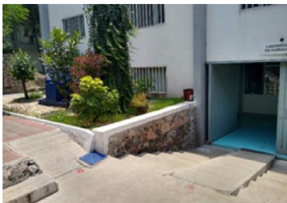
Figura 9. Instalaciones de la UAQ con calidad deficiente.

Existen también lugares de estacionamiento reservados para personas en situación de discapacidad, la información del número de espacios no está disponible tampoco, debido a que recientemente se realizó un ajuste de espacios de estacionamiento en la Facultad de Ingeniería. Cabe destacar que en ocasiones estos espacios no son respetados, y no existe penalización alguna para los infractores. Para este tipo de situaciones también se han impartido diferentes cursos y talleres de sensibilización dirigidos a la comunidad universitaria, incluidos profesores, alumnos, administrativos y trabajadores.