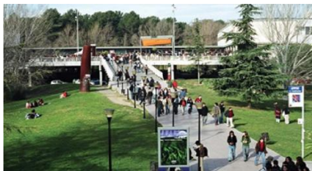
Figura 2. Área de estudio, instalaciones de la UAB.

El Área de estudio se define por el campus universitario de la Universidad Autónoma de Barcelona, ubicado en 08193 Bellaterra, Cerdanyola de Valles, Barcelona, España, y las instalaciones del campus central de la Universidad Autónoma de Querétaro, ubicado en 76010 Centro universitario, colonia Las Campanas, Santiago de Querétaro, México.