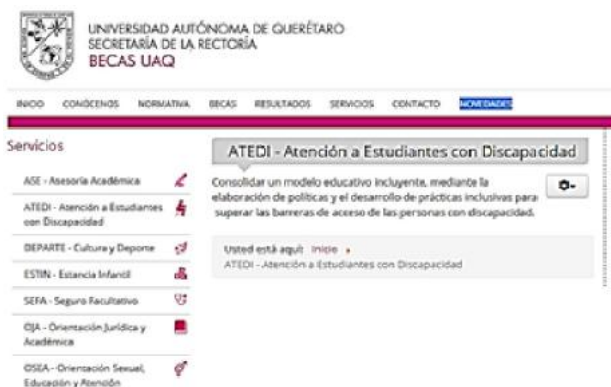
Figura 6. Interfaz de página web ATEDI UAQ.

En la información obtenida por medios electrónicos sobre un primer contacto de las personas en situación de discapacidad y la Universidad Autónoma de Querétaro es la siguiente: existe un servicio de Atención a Estudiantes con Discapacidad (ATEDI) que plantea la creación de un modelo educativo inclusivo. Este servicio está relacionado al portal de la Secretaría de la Rectoría en el apartado de becas, sin embargo, no tiene información sobre los servicios que ofrece, algún correo de contacto, lugar de contacto o persona responsable de este servicio, lo único existente en la página se muestra en la Figura 6.