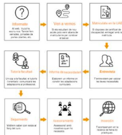
Figura 5. Proceso de vinculación y registro PIUNE.

Dicha sesión informativa se realiza dentro de las instalaciones del campus Bellaterra de la UAB, y se discuten las líneas de acción en diferentes ámbitos del PIUNE. Se pueden facilitar algunos aspectos académicos y tecnológicos, de movilidad, becas, estudiantes de soporte e inserción laboral con la ayuda del colectivo UAB-Impuls. El proceso de registro para el PIUNE es como se muestra en la siguiente ilustración.