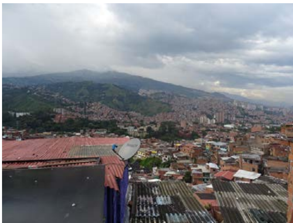
Figura 8. Panorama de Medellín desde el barrio de Las Independencias I (2022).

Las esquinas eran vista siempre como la esquina del ladrón, del borracho, de pandillero, en estas esquinas empezamos a bailar, a pintar, a cantar, y vimos como al tiempo el adulto mayor regresó a esta esquina, a jugar a carta, domino, ajedrez; los parques los volvimos en salones de clase de graffiti, de breakdance, de rap, vimos como la familia volvía al parque; donde había fronteras invisibles montamos tarimas para hacer conciertos (Ciro, comunicación personal, 2022).