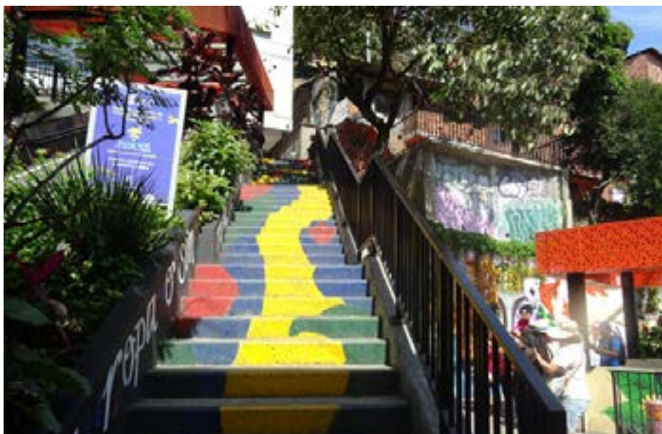
Figura 9. Escalera en Medellín (2022).

El arte por acá ha tenido muchos efectos porque todas las imágenes han compuesto mucho el barrio. Las imágenes son muy bonitas porque esto hace que la gente vive muy feliz, no como antes. Los murales son muy lindos porque se ve un ambiente muy bueno, llega mucha gente a visitar el barrio, entonces uno se siente muy orgulloso de su barrio, y se siente muy orgulloso de la gente, porque hay bastante gente y porque antes uno se mantenía siempre encerrado y ahora uno puede volar. Ya la gente por acá son muy amable, muy buena gente, buena onda. A mí me fascina todo lo que hacen por acá. Me gustan los colores, me gustan los colores fuertes (Julieth, comunicación personal, 2022).