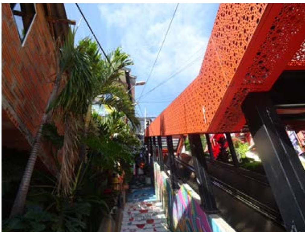
Figura 5. Escaleras eléctricas de Las Independencias I en Medellín 2 (2022).

Ahorita, por unos 5 años o más ya el barrio empezó a calmarse, ya uno por acá no ve muertos, ya es todo suave, todo bueno, ya todas las cosas van cambiando, no tenemos peligro. Ya usted anda a la hora que sea, usted deja la puerta de su casa abierta y no le pasa nada. Antes uno no podía dejar la puerta abierta porque entraban le sacaban todo, le robaban todas las cosas (Julieth, comunicación personal, 2022).