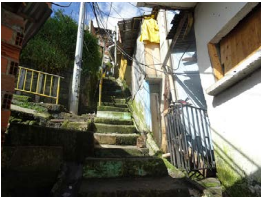
Figura 2. Callejones y escaleras en Las Independencias II en Medellín (2022).

Incluso lo dicho por Jairito, atravesando su barrio Eduardo Santos, como se puede ver en la Figura 3: