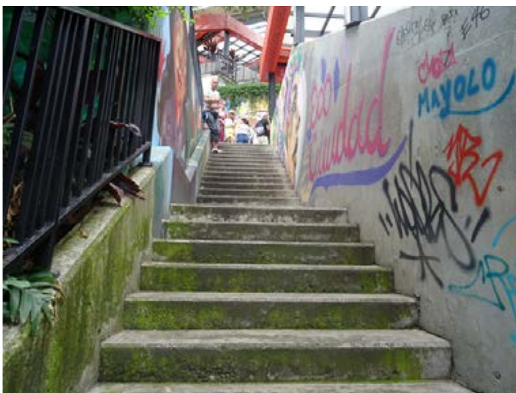
Figura 4. Barrio Las Independencias I en Medellín (2022).

Operación Mariscal empezó a las 3 de la mañana y Orión empezó a la medianoche, todo nos cogió en la casa. Ya todos sabían un protocolo de seguridad: si se arma la balacera todo el mundo coge colchones, va para el baño, y pega un colchón a la pared y otro colchón en el piso para estar sentado. Era dormir ahí, era aguantarnos, y la mayoría de la gente, los papás y amigos que trabajaban en la noche, no tenían forma de entrar al barrio por 4 días, porque todo lo que se movía en la calle era un objetivo militar (Ciro, comunicación personal, 2022).