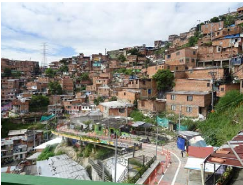
Figura 6. Barrio Las Independencias II en Medellín (2022).