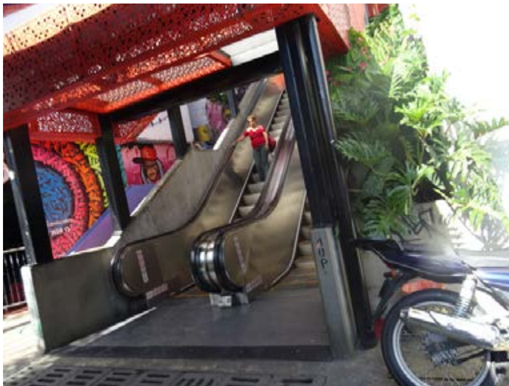
Figura 1. Escaleras eléctricas de Las Independencias I en Medellín (2022).