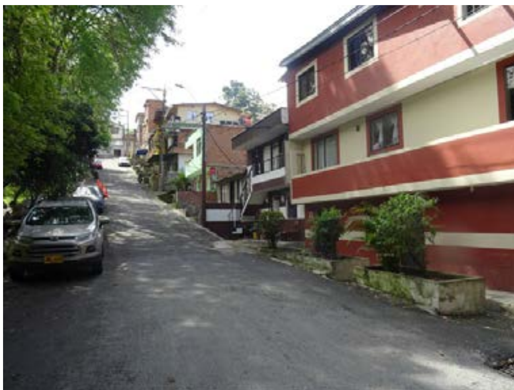
Figura 7. Calle del barrio Eduardo Santos en Medellín 2 (2022).

Yo creo que hoy hay mejores personas dentro del barrio, dentro de la comunidad, personas que quieren hacer algo. Para mí siempre han estado poquitos los que querían hacer cosas malas. Yo le echo la culpa al microtráfico, pero cada vez hay más poco pelados en este ámbito. Esta sociedad tiende a cambiar, y tiende a cambiar para bien: ¡mira que lo hemos logrado! Todo está cambiando y esto se va a volver un mejor territorio el día de mañana, yo creo que no tenemos que esperar demasiados años para que esto pase (Jairito, comunicación personal, 2022).