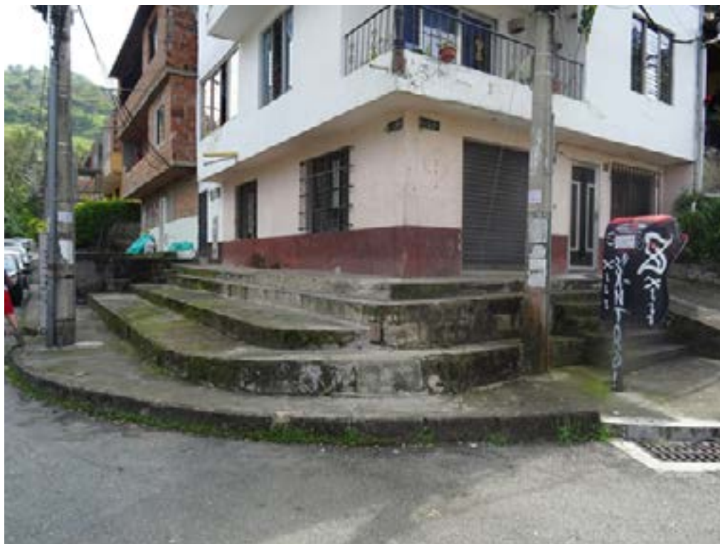
Figura 3. Barrio Eduardo Santos en Medellín (2022).