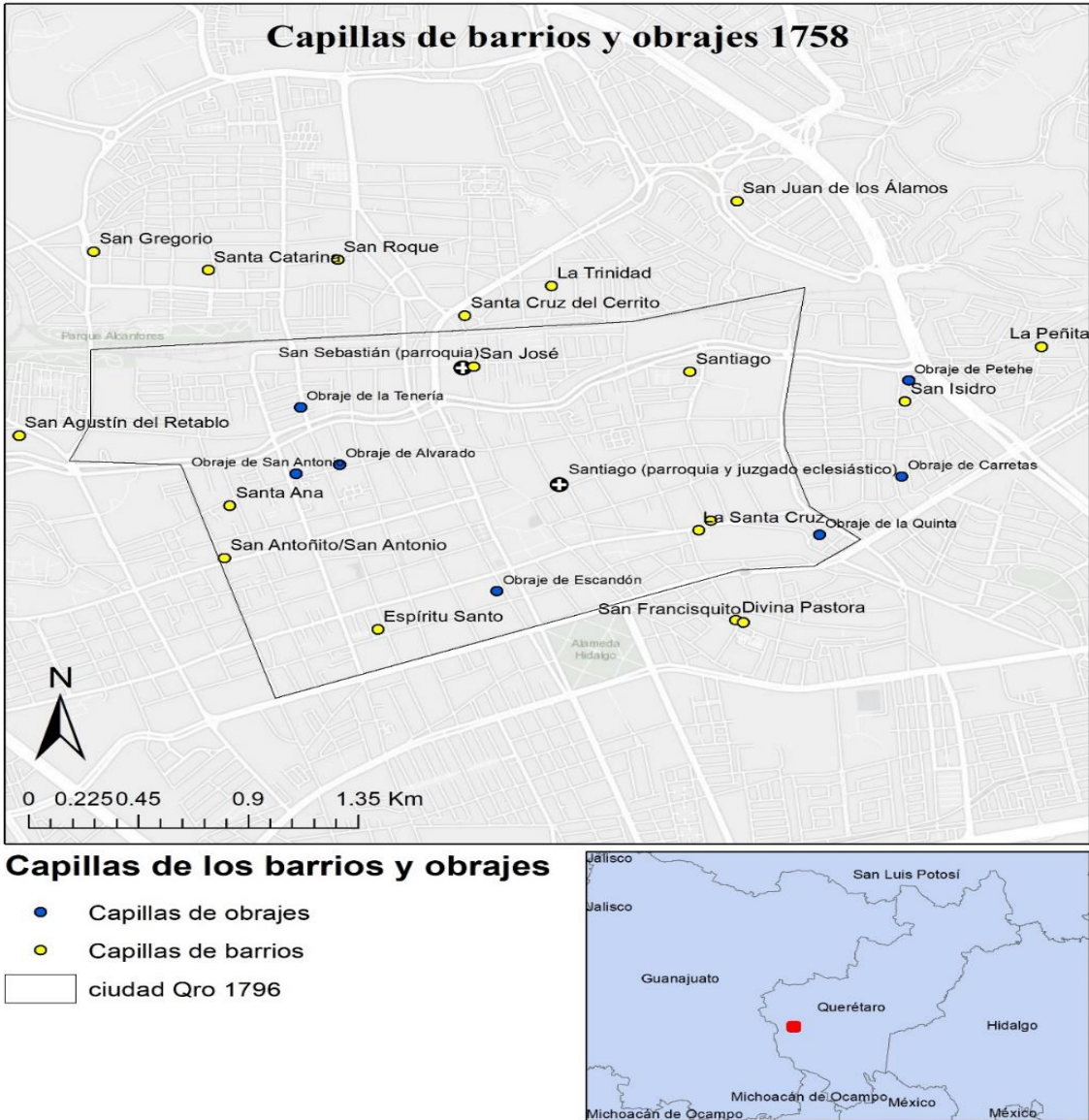
Mapa no. 1. Capillas de barrios y obrajes de Querétaro en 1771

tos también realizados por William B. Taylor, Icaza Longoria y Mathew O'Hara.