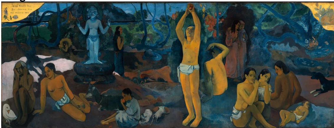
Imagen no. 12 31