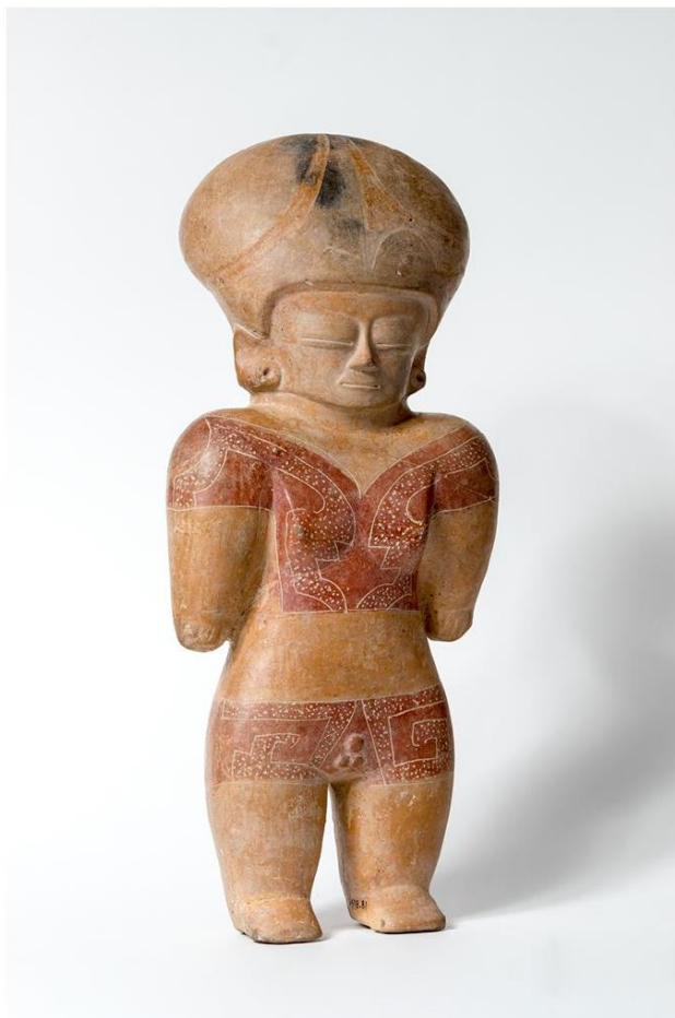
Figura antropomorfa, cultura Chorrera, cerámica, 38,5 x 16,3 x 9,8 cm.