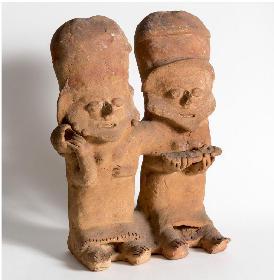
Figura doble antropomorfa, cultura Bahía, cerámica, 32,2x 24,2x 13,3 cm.

Con estas figuras se queda abierta la discusión sobre la diversidad sexo-genérica en la época prehispánica y su participación en la configuración de la estructura social y familiar de las mismas. Una vez puesto este precedente en la historia es innegable que el Ecuador actual, quiera o no, viene tanto de personas clasificadas dentro del binarismo sexo-genérico 12 como de personas identificadas dentro de la diversidad sexo-genérica. Sería un encuentro violento que introdujera nuevas concepciones sobre la familia, la sexualidad y el género a las diferentes nacionalidades indígenas, y quienes no se sujetaran a esto sufrirían del etnocidio ya conocido. Se recuerda la cita de Hernán Cortes mencionada a