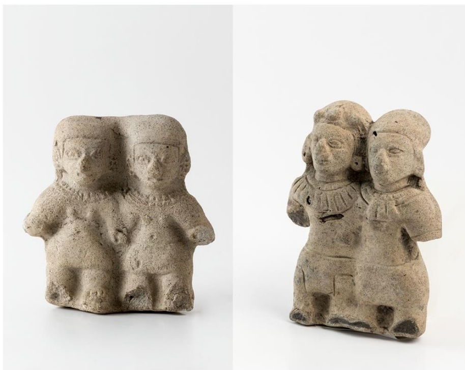
Figura doble antropomorfa, cultura Tolita (Tumaco), cerámica, 13,2 x 10,1 x 2,5 cm.