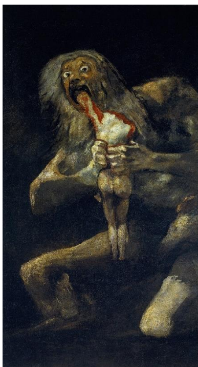
Imagen no. 10 28

Pero, como se dijo antes, ya desde Freud se aceptaba que el género se construye según su contexto. Aquí unos intentos de explicar lo que él llama 'inversión sexual':