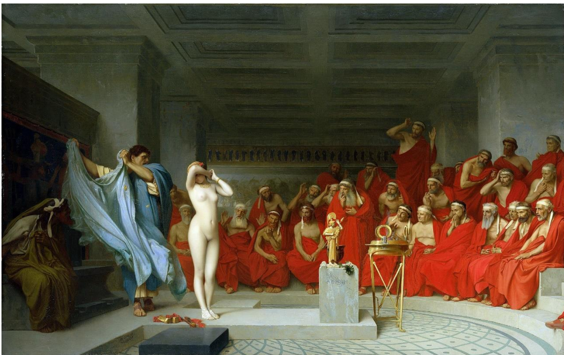
15 Gerome, Jean León. Friné revelada ante el aerófago, 1861 (Óleo).