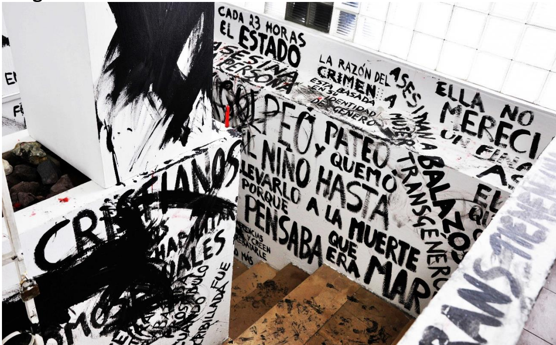
Imagen no. 11 30

¿Y qué es aquello que dice ser un ser humano plenamente viviente? Más atrás se dijo que el derechos es el barómetro moderno de humanidad. Una facción de la teoría de género pretende deslegitimar dicho barómetro, prescindir de él. Pero otra parte de esa lucha política lo ve como necesario. Mientras no exista un cambio estructural cultural, que garantice la vida de los sujetos de géneros diversos, estos necesitarán de un amparo tanto metafísico (legalidad) como material (fuerza física